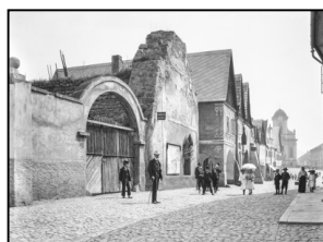
Ústěk, 16. 6. 1907, bývalá brána, pohled k náměstí z ulice 1. máje [nD0524]