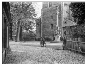
U kostela ve Frýdlantu [nF1516]

Najdi na výstavě fotografie, jak tato místa vypadala dříve. Pozorně si je prohlédni a zkus u každého místa najít co nejvíce rozdílů mezi minulostí a současnou podobou.